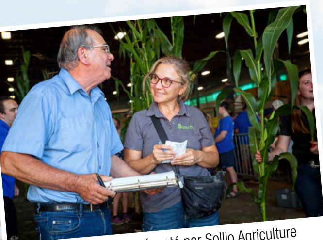
Le volet Végétal a été présenté par Sollio Agriculture