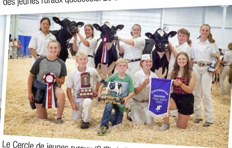
Le Cercle de jeunes ruraux (CJR) de Portneuf a remporté la bannière de conformation, la grande championne suprême et la classe de groupe à la Classique des jeunes ruraux québécois.