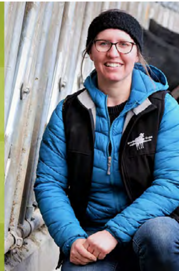
table est un balado mensuel qui met en vedette des entrepreneurs agricoles et