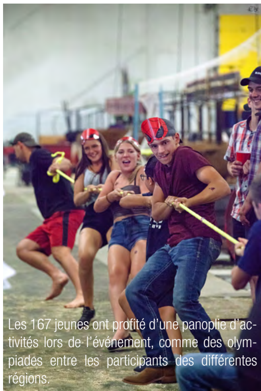
Les 167 jeunes ont profité d'une panoplie d'activités lors de l'événement, comme des olympiades entre les participants des différentes régions.

L'AJRQ rassemble plus de 600 jeunes de partout au Québec qui sont intéressés par le milieu rural et par le secteur de l'agroalimentaire.